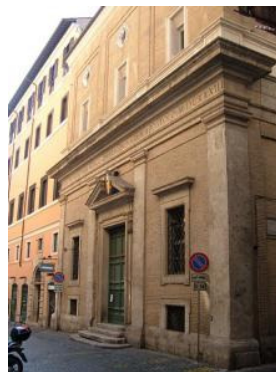
Oratorio del Caravita

Al di là dell'isolato funziona ancora per le attività della Compagnia l'oratorio di san Francesco Saverio, detto del Caravita (eretto dal padre Pietro Caravita, + 1658), che fu centro dell'intenso apostolato dei padri e degli scolastici del collegio.